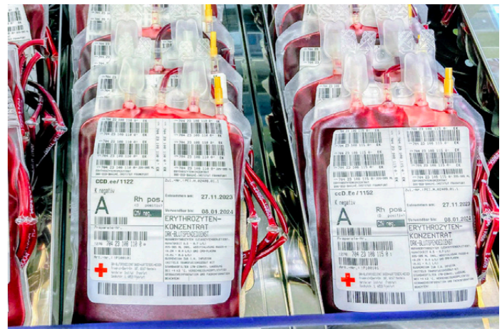
Blutbank, Im Neuenheimer Feld 305, 69120 Heidelberg