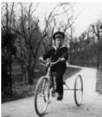
Bekanntlich befanden sich in den Königshäusern einige Nachkommen, die an der sogenannten Bluterkrankheit litten. Die Abbildung trägt den Titel: Der Zarewitsch Alexis auf einem Dreirad, 1906, K. Gan, Das Staatliche Historische Museum in Moskau.

der Veranstaltungen bei der Ausstellung begrüßen zu können.