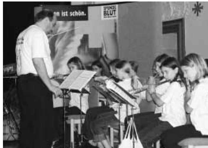
Die Bläserklasse des Marianums beim Informationsabend in Fulda.

Der DRK-Blutspendendienst führt die Informationsveranstaltungen in allen Regionen Hessens durch. Alle Interessierten sind herzlich dazu eingeladen. In diesem Jahr sind noch folgende Veranstaltungen geplant: Mittwoch, den 17. Oktober in Bad Wildungen, Dienstag, den 6. November in Darmstadt und Dienstag, den 4. Dezember in Weilburg. Nähere Informationen und weitere Termine erfahren Sie aus der regionalen Presse oder im Internet unter www.bsdhessen.de .