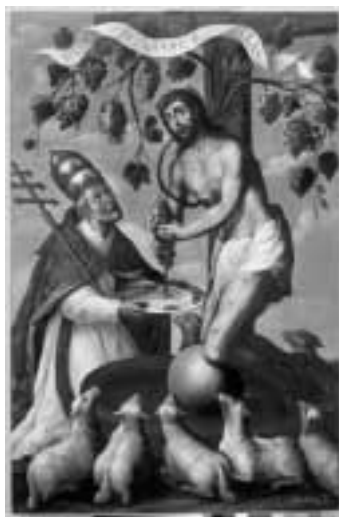
Allegorie der Eucharistie, 1690, Juan Correa (1646-1716), Mayer Collection, Denver

Zudem werden zwei Podiumsdiskussionen vorbereitet. Eine der Diskussionen soll die nun seit 10 Jahren bestehende Knochenmarkspender-Datei des DRK-Blutspendedienstes Hessen vorstellen. Die zweite Podiumsdiskussion wird sich mit der Arbeit des DRK-Blutspendedienstes befassen. Gegenstand dieses Gesprächs wird neben der Blutspende auch die umfangreiche wissenschaftliche Arbeit des zum DRK-Blutspendedienst gehörenden Instituts für Transfusionsmedizin und Immunhämatologie sein.